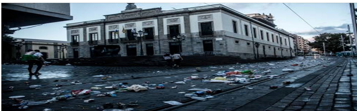
C/ Las Macetas, s/n. Los Majuelos Pabellón Insular Santiago Martín 3ª Planta 38108. La Laguna. Santa Cruz de Tenerife

En las recientes fiestas del Carnaval de Santa Cruz de Tenerife se hizo visible, gracias a la implicación de la ciudadanía concienciada, una situación lamentable que daña gravemente la imagen no solo de la Ciudad sino de la Isla en su conjunto. Se han difundido escenas impresionantes de suciedad, compuesto sobre todo por bolsas, vasos y botellas de plástico, que cubrían como un penoso tapete hediondo las calles del centro de la capital. En realidad, esta situación lleva años siendo denunciada por personas y colectivos sensibilizados con esta problemática, que han venido mostrando su malestar al observar cómo en muchas fiestas y celebraciones públicas o privadas se genera una cantidad, que se puede calificar de obscena, de residuos (sobre todos plásticos de diverso tipo) impropia de una sociedad que pretende ser avanzada y con una absoluta pasividad de las administraciones públicas implicadas.